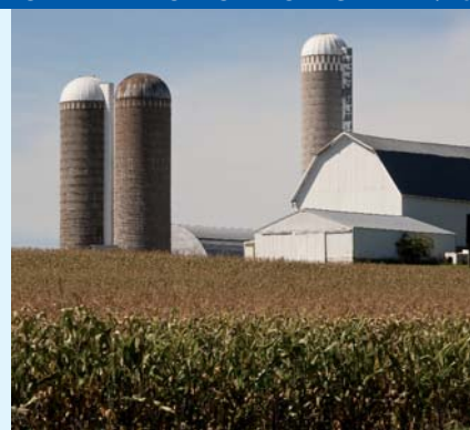
VALUTAZIONI AMBIENTALI E FONDARIE