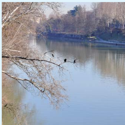
SICUREZZA E GESTIONE DEL TERRITORIO