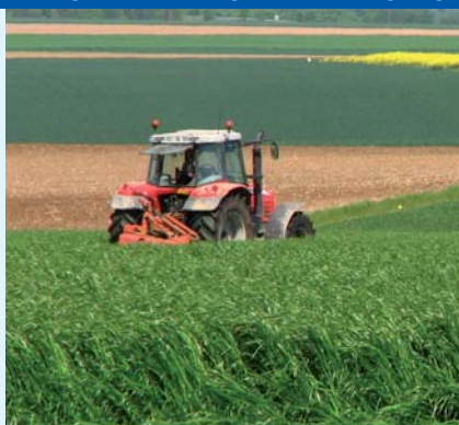
SVILUPPO RURALE SOSTENIBILE