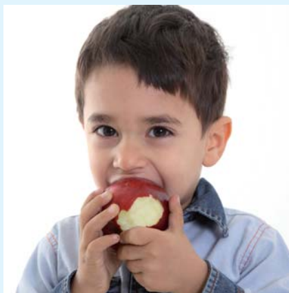
QUALITÀ E SICUREZZA AGROALIMENTARE