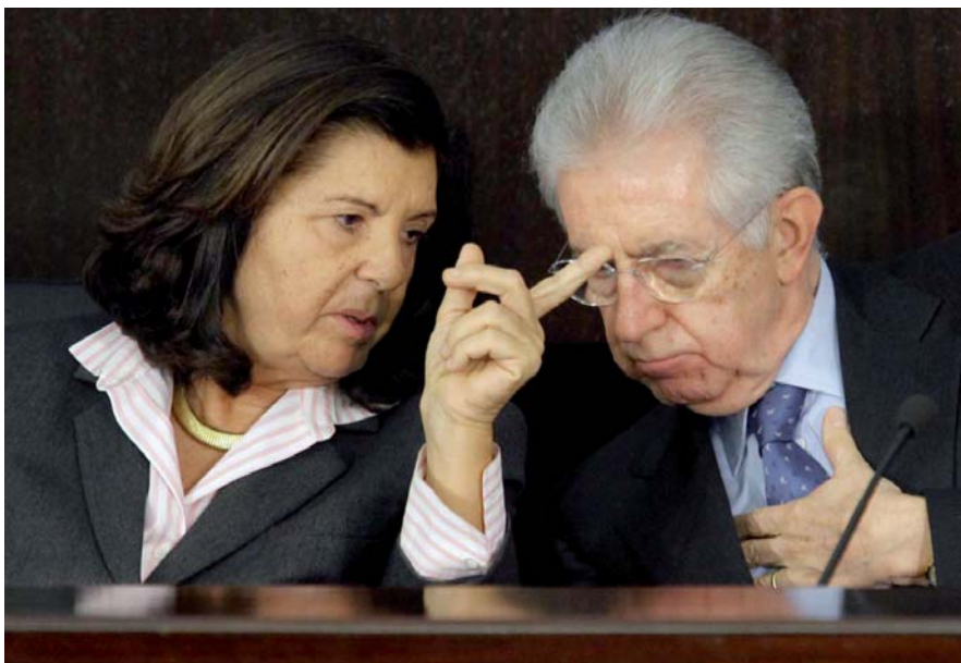
Paola Severino e Mario Monti

contenuto e il contributo del professionista che come tale deve avere la maggioranza assoluta. È ovvio, poi che nei tavoli di consultazione che continueremo ad avere, sarà anche importante la regolamentazione del modello organizzativo di questa società di professionisti che deve garantire la qualità della prestazione professionale, l'assenza di conflitti di interesse, la possibilità del professionista di rimanere tale, ovvero di non essere condizionato nelle sue scelte professionali che devono garantire il cliente da interferenze che siano esclusivamente di carattere capitalistico ed economico».